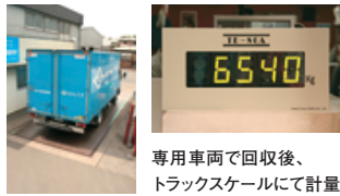
専用車両で回収後、トラックスケールにて計量。

お客様のオフィスの現状を伺い、それに基づき、お見積りや回収メニューをご提案いたします。