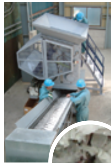
破碎機で破碎された機密書類 [原寸大]

破碎した書類は梱包し製紙メーカーに運ばれます。そこで溶解され、再びトイレットペーパーなどの紙製品に生まれ変わります。