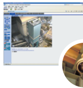
営業所の入口、保管庫の室内には監視カメラがあり、事務所にて確認。